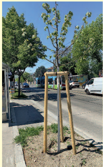
58B Hetzendorfer Straße 163 (April 2026)

Nach unserer dringlichen Anfrage hat die MA 42 (Stadtgartenamt) in Erfüllung unseres ursprünglichen Antrags an der Ecke Hetzendorfer Straße/Werthenburggasse eine fachgerechte Neupflanzung vorgenommen! 😊