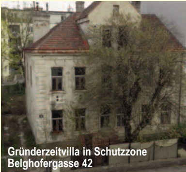
Gründerzeitvilla in Schutzzone Belghofergasse 42

Die jeweils in einer Schutzzone stehenden historischen Wohnhäuser (Belghofergasse 42 und Hetzendorfer Straße 84) werden von ihren wechselnden Eigentümern systematisch dem Verfall preisgegeben (siehe Abb.). Gegen diese Strategie einer Ausschöpfung sämtlicher Rechtsmittel zur endlosen Verzögerung einer Haussanierung haben zuständige Behörden in ihrem engen gesetzlichen Handlungsspielraum wenig Erfolgchancen. Als Folge des fortgeschrittenen und irreparablen Substanzverfalls erhalten die Eigentümer letztendlich genau das, worauf sie spekuliert haben: Einen Abbruchsbescheid mit optimalen Aussichten auf einen lukrativen Grundstücksverkauf oder den Bau eines noch größeren Mehrparteienhauses.