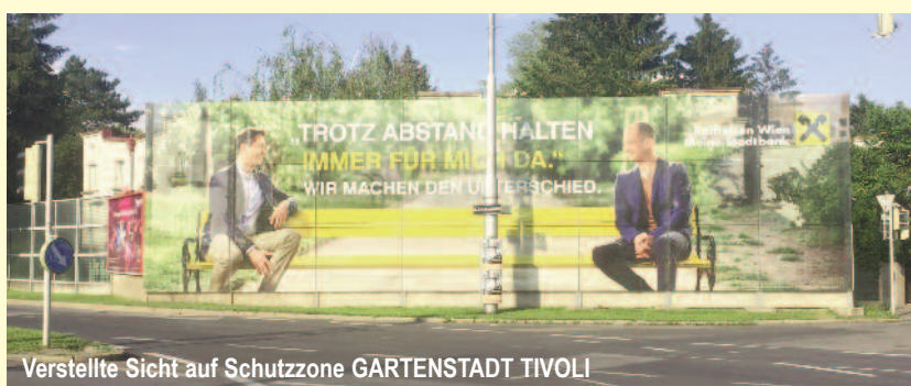
Verstellte Sicht auf Schutzzone GARTENSTADT TIVOLI

So etwa könnte man die Reaktion der zuständigen MA 19 (Stadtgestaltung und Architektur) auf die harsche Kritik am zugedeckten Anblick des historischen Ensembles GARTENSTADT TIVOLI durch die voll eingefärbte Werbewand zusammenfassen. Wieviel Narrenfreiheit gesteht man im Rathaus dem omnipräsenten Werberiesen GEWISTA denn noch zu?