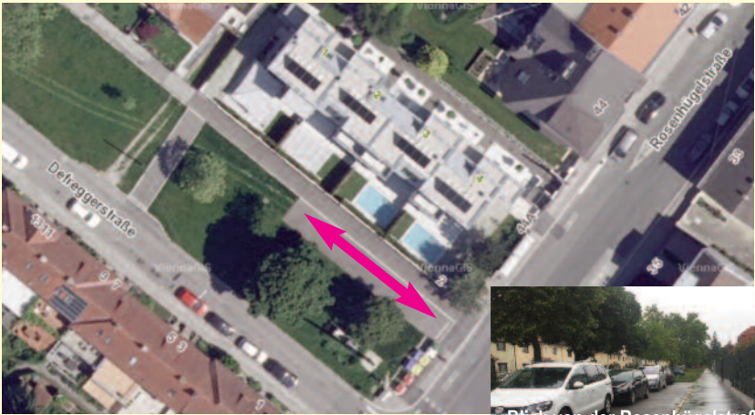
Blick von der Rosenhügelstraße in die teilversiegelte Grünzone Defreggerstraße