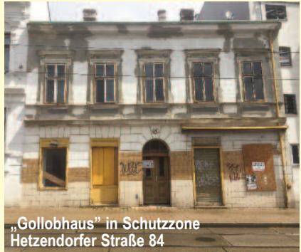
„Gollobhaus“ in Schutzzone Hetzendorfer Straße 84

PH hat dazu eine detaillierte Anfrage eingebracht und wird über deren Beantwortung berichten.